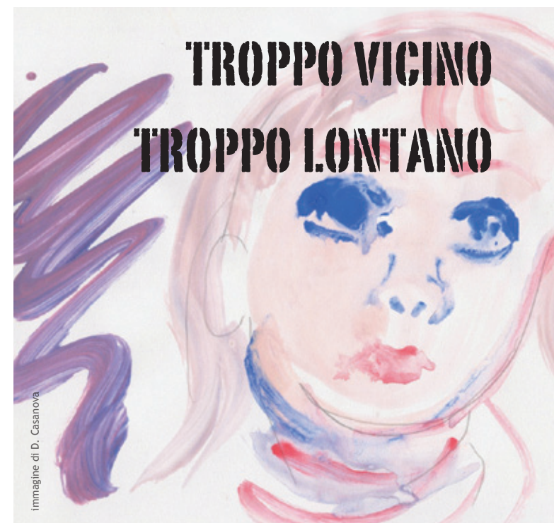
immagine di D. Casanova

Nella mappa a lato segnaliamo la sede del seminario (ALBA, Via Vida 10, Sala Multimediale Asl CN2) indicata con il pallino rosso e due comodi parcheggi.